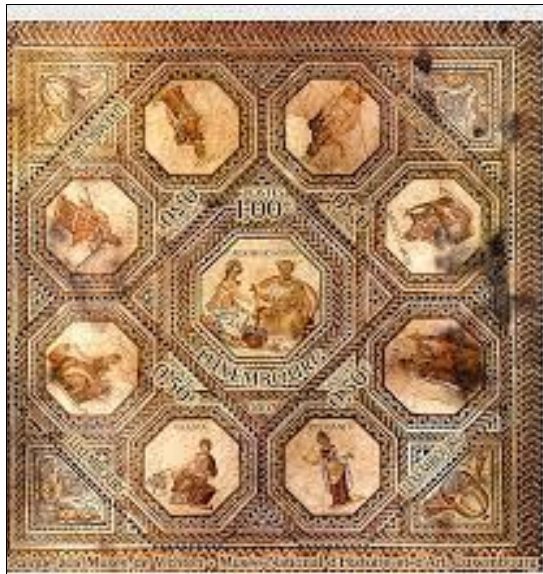
Mosaïque romaine provenant d'une villa à Vichten

لم يكن للرومان الوسائل الكافية كي يدافعوا بشكل فعال عن الإقليم الذي كان يتسع شيئاً فشيئاً. كما ازداد ضغط القبائل الألمانية الراغبة في الهجرة جنوباً وغرباً خلال القرنين الرابع والخامس، فانهارت الإمبراطورية وانتشر الدين المسيحي بسرعة في الإمبراطورية الرومانية.