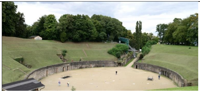
Amphithéâtre à Trèves où des Chrétiens furent martyrisés