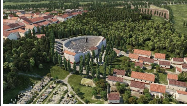
Reconstruction de l'agglomération romaine de Dalheim