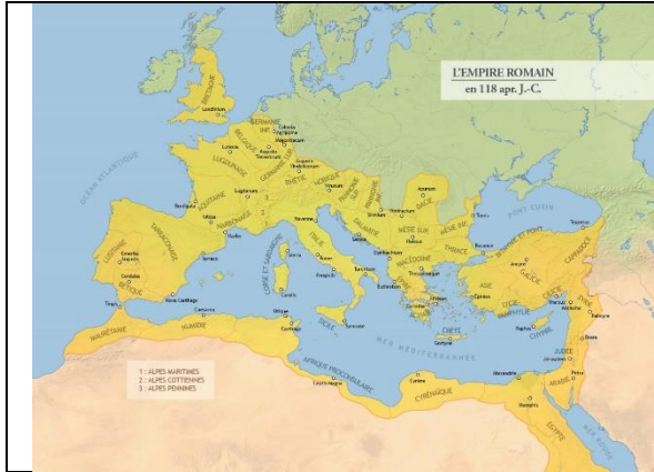
L'empire romain au moment de sa plus grande extension

كانت الإمبراطورية الرومانية من أعظم الإمبراطوريات الموجودة على وجه الأرض. شرع سكان قرية إيطالية صغيرة منذ القرن الثامن قبل الميلاد، في تأسيس إمبراطورية عظيمة استمرت حتى القرن الخامس الميلادي في أوروبا وامتدت حتّى الى الشرق.