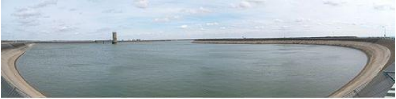
الحوض العلوي Le bassin supérieur

تتدفق كميات المياه المخزنة في الحوض العلوي على مسافة 280 مترًا في توربينات تقع في الكهوف (40000 لتر في الثانية لكل توربين) وبذلك توفر كهرباء إضافية لمدة 4 ساعات في اليوم. على سبيل المثال، في الصباح عندما ينهض الناس ويذهبون إلى العمل، يزداد استهلاك الكهرباء بشكل حاد؛ عندها تحول المحطة انتاجها لشبكة الكهرباء الألمانية. في الليل، عندما يكون التيار الكهربائي منخفض الثمن، يتم إعادة ضخ الماء إلى الحوض العلوي.