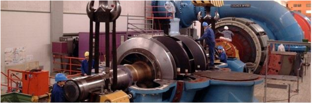
عنفة كهرومائية turbine hydroélectrique