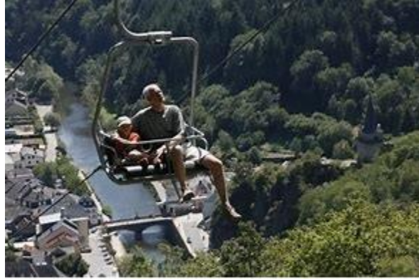
المقعد المعلق Le télésiège

يوجد المقعد المعلق الوحيد في فياندين. انطلاقاً من الوادي على ارتفاع 220 م ، يقود الزائر إلى أعلى التل على ارتفاع 440 متر معطياً إطلالة بانورامية جميلة على المدينة و القصر والسد.