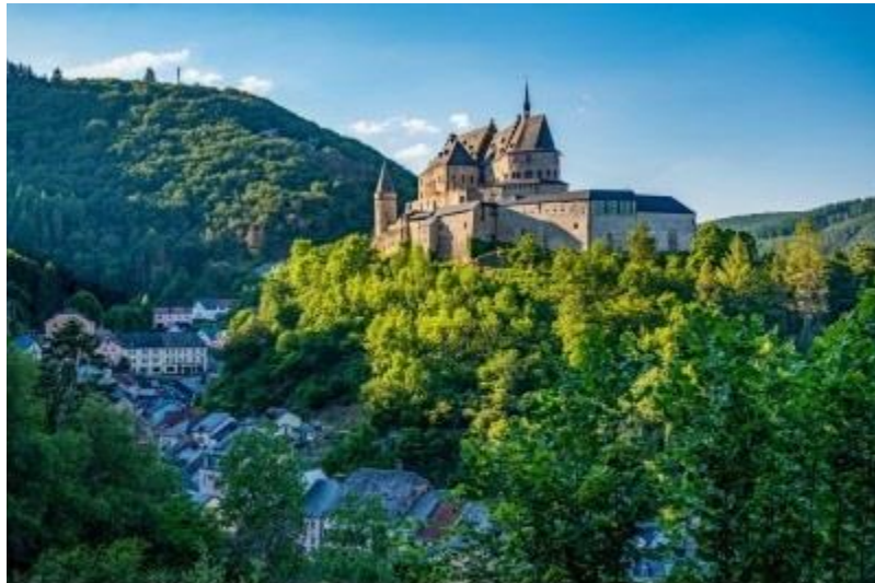
القصر Le château

أصبح القصر بعد ذلك على ملك العائلة التي انحدر منها ملوك هولندا. في عام 1820 ، قام ملك هولندا ببيع القصر لتاجر الذي قام بدوره ببيع العوارض الخشبية والحجارة المصقولة. انهار القصر وتحول إلى أنقاض إلى أن تم شرائه من قبل الدولة اللوكسمبورغية سنة 1977 وأعيد بناؤه.