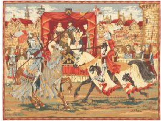
Tournoi de chevaliers