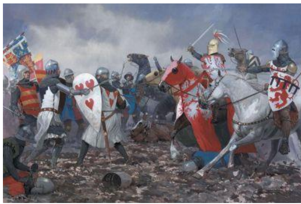
Jean l'Aveugle est conduit à la bataille de Crécy