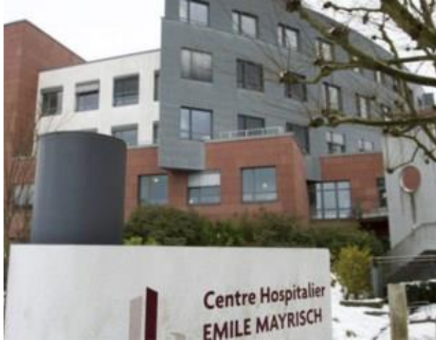
مستشفى إيميل مايرش في إيش