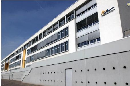
ثانوية الين مايرش في لوكسمبورغ