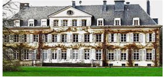
مؤسسة إيميل مايرش في كولباش (مكان للعناية والراحة)