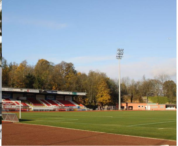
ملعب إيميل مايرش في إيش